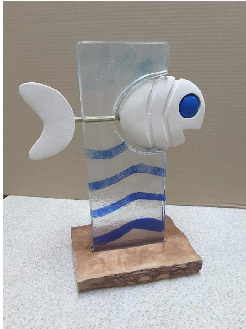
Figure 2 : Réalisation d'un participant de l'atelier verre – Saison 2021/2022

5) Améliorer notre communication pour donner à voir, à comprendre et l'envie de participer.