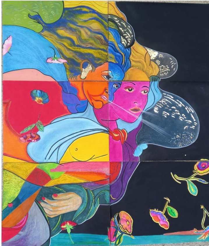
Figure 3 : Réalisation collective de l'atelier dessin adultes – Saison 2021/2022

Se mettre dans une démarche de création renforce la confiance de chaque individu.